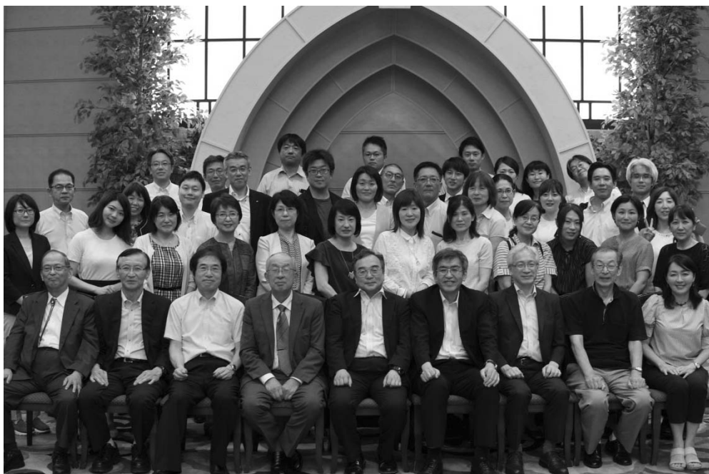
第78回日本産業衛生学会東北地方会懇親会会場にて

*東京オリンピック開催のため、例年より一週間早い、7月第3週目の開催となりますので、ご注意ください。