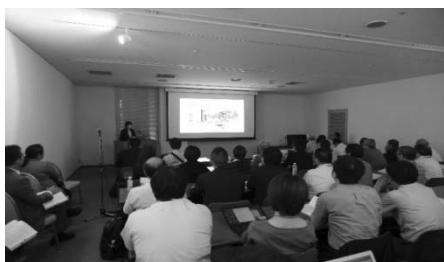
産業衛生技術部会教育講演会場の様子 (立ち見が出るほどの盛況でした)